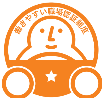
「一つ星」認証マーク