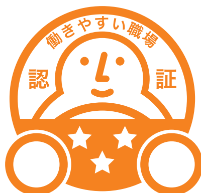
「三つ星」認証マーク

認証を取得した事業者は下記の認証マークを本会の基準（合格事業者に案内）に従って、名刺、パンフレット、ホームページ、備品、建物、車両等に使用することができます。このマークは、笑顔で働くドライバーをイメージしたもので、ドライバーの皆さんが安心して働ける職場環境を提供している事業者が一目でわかることを意図して作成されました。星の数は職場環境の良好度を表しています。