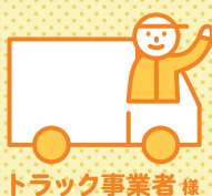
トラック事業者様