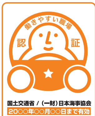
▲ 働きやすい職場認証ステッカー