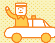
タクシー事業者様

職場環境の改善に力を入れてきましたが、自社で宣言しても説得力がありませんでした。今回、第三者機関からの認証取得を前面に出すことで採用に効果が表れています。