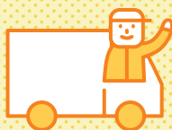
トラック事業者様