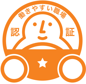
「一つ星」認証マーク